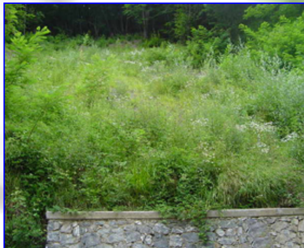
Foto 3 – Intervento a regime dopo le fasi di idrosemina e inerbimento. Si noti la diffusa copertura vegetale che funge da schermo contro il progredire dei fenomeni di dilavamento e dissesto