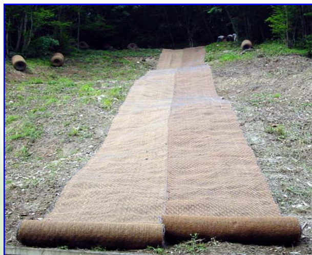
Foto 1 – Fasi iniziali di stesa e posa in opera del Geocomposito R.E.C.S.® in un intervento di rinforzo corticale di un pendio in forte erosione

La Borghi Azio S.p.A. fornisce ai progettisti interessati supporto tecnico in fase progettuale.