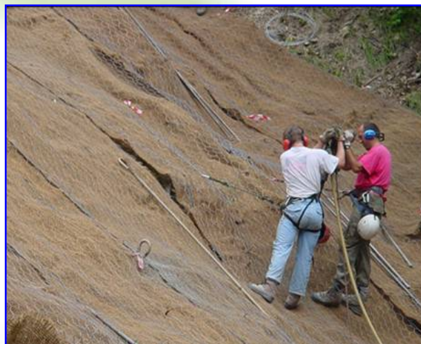
Foto 2 – Realizzazione del sistema di chiodatura per l'ancoraggio del rinforzo corticale mediante utilizzo di fioretto tipo Tayo e barre autoperforanti di diametro Ø32mm