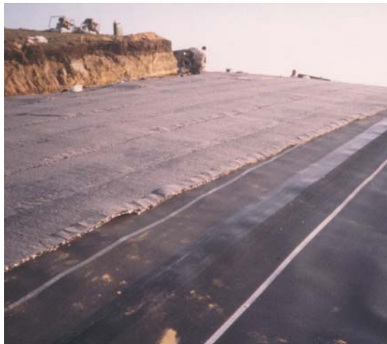
Copertura di discarica