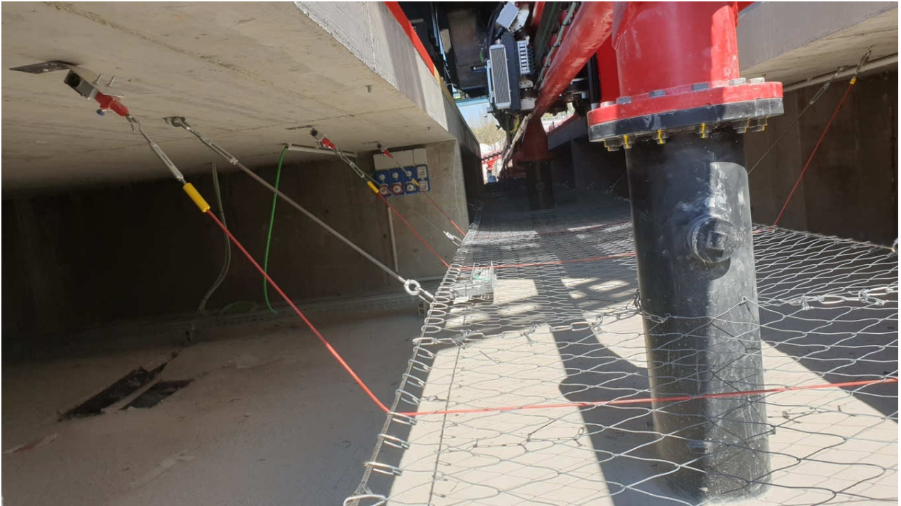
La rete montata è in versione Inox