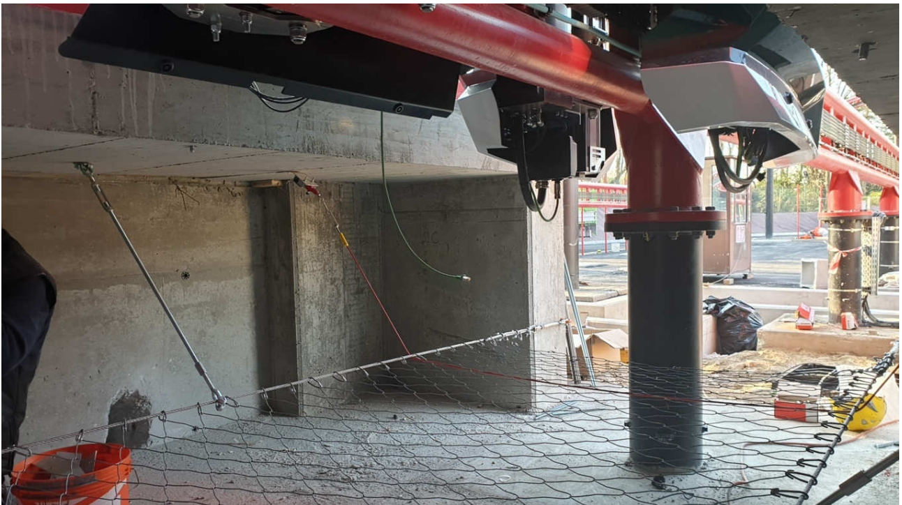
L'adozione della protezione messa a punto da Geobruugg e ID Linee Vita ha consentito la certificazione dell'attrazione da parte dell'ente certificatore tedesco TUV