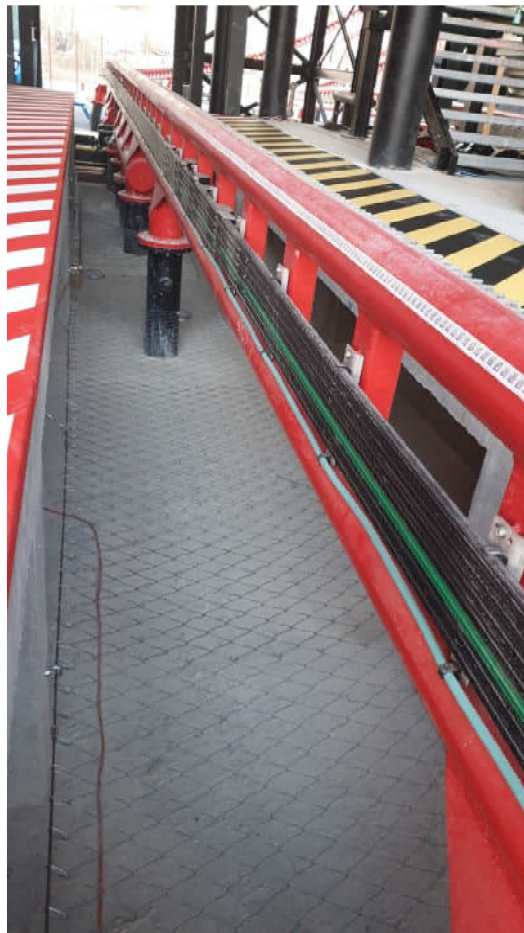
Il binario dove scorre la riproduzione della motocicletta