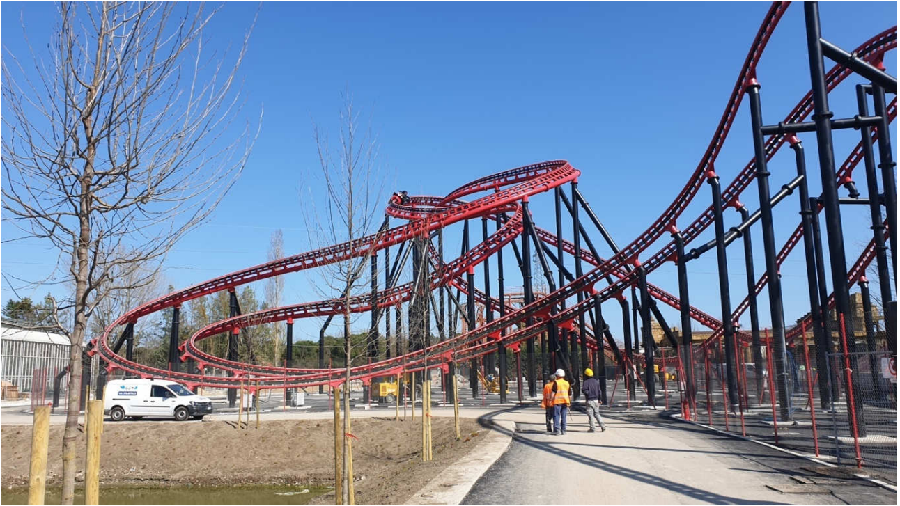
Desmo Race il duelling coaster interattivo a doppio binario di Mirabilandia